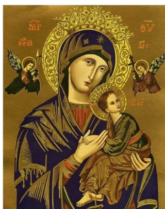
Our Lady of Perpetual Help