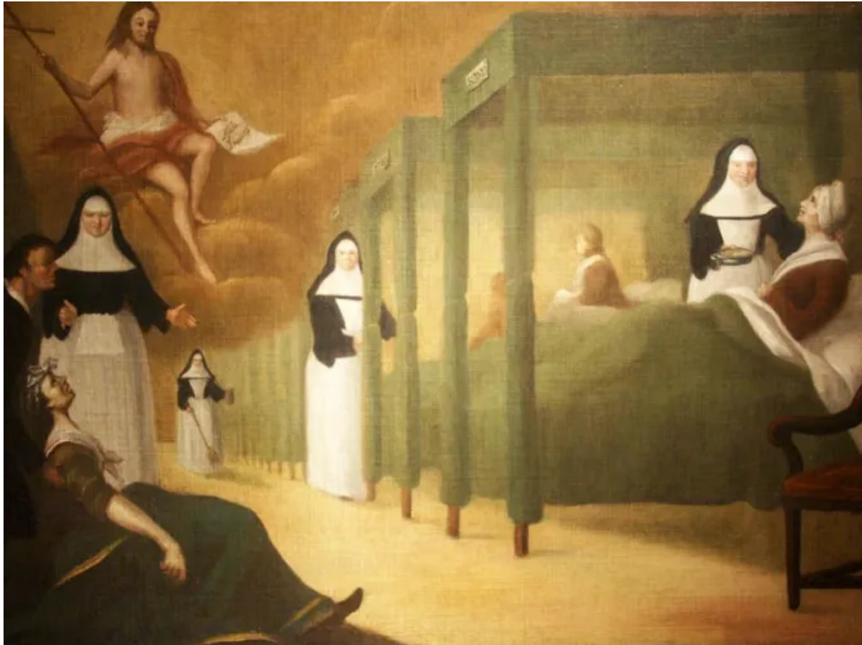
Lugares para visitar en Quebec: Hospitalières de Saint-Joseph

Este museo cuenta los orígenes de Montreal y del Hôtel-Dieu (primera institución hospitalaria de la ciudad) a través de la medicina de la época y la misión de las Hospitalières de Saint-Joseph con las personas enfermas. Muebles, pinturas, esculturas, fotografías, documentos de archivo e instrumentos médicos testimonio de esta rica historia.