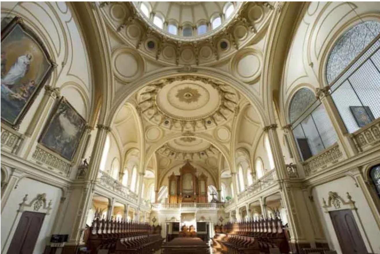
Lugares para visitar en Quebec: Monasterio de las Ursulinas

El Pôle Culturel du Monastère des Ursulines está situado en el inspirador escenario donde se fundó el Monasterio de las Ursulinas en Nueva Francia y donde también se fundó la primera escuela para niñas en Norteamérica. Muestra el excepcional patrimonio de las monjas ursulinas