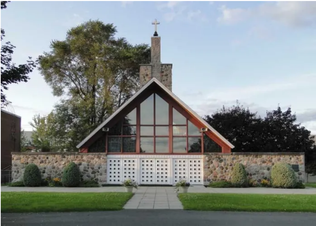
Lugares para visitar en Quebec: Sainte-Marguerite-d'Youville

Comenzando en Kahnawake , una comunidad mohawk, el circuito pasa por Longueuil y Boucherville , para terminar en Varennnes . Explore cinco santuarios en los que el arte visual y la arquitectura crean un peregrinaje que hará que la tradición y la historia cobren vida ante sus ojos. Venga en familia o con amigos y siga esta ruta para vivir una experiencia única, tanto espiritual como cultural. Saboree la impresionante belleza del patrimonio único a lo largo del majestuoso río San Lorenzo, que podrá disfrutar a menos de una hora de Montreal .